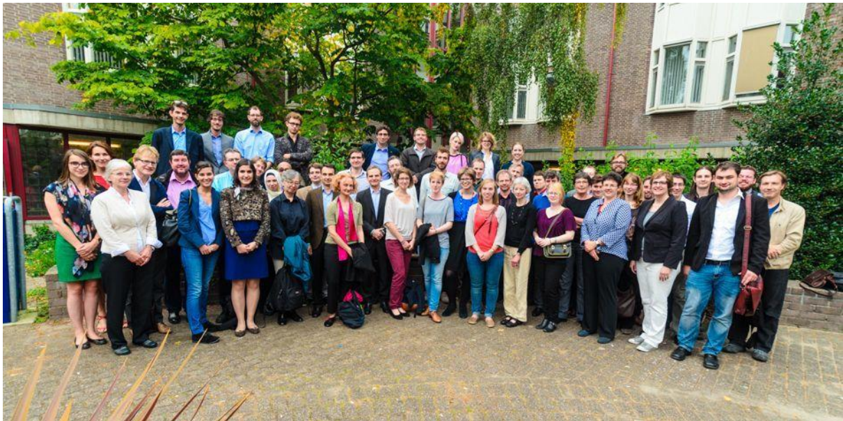
Foto: Deelnemers internationale conferentie OPG / APH Leiden 2014

Waar in het buitenland de OPG onderscheidend is door de samenwerking op nationaal niveau, valt de OPG in Nederland op door zijn sterke internationale oriëntatie. De universiteiten van Antwerpen en later Münster zijn vertegenwoordigd in de school. Standaard krijgen promovendi een tweedaagse module internationalisering aangeboden. Maar bovenal is de OPG een van de initiatiefnemers van de in 2014 in Lucca opgerichte Association for Political History. Vanaf dat moment vervulde de OPG het secretariaat en beheerde de financiën van de internationale organisatie. Deze bijzondere rol kan juist Nederland vervullen dankzij de bijzondere constructie van de onderzoekschool. Een van de belangrijkste activiteiten van de APH is de organisatie van jaarlijkse conferenties waar met name promovendi welkom zijn. Daarnaast is de serie Palgrave Studies in Political History tot stand gekomen. Inmiddels nemen 19 universiteiten uit 12 landen deel in de APH. In 2025 vindt de jaarlijkse conferentie plaats in Antwerpen onder de titel 'How to decolonize political history' en ligt er een wens het werkerrein verder te verbreden.